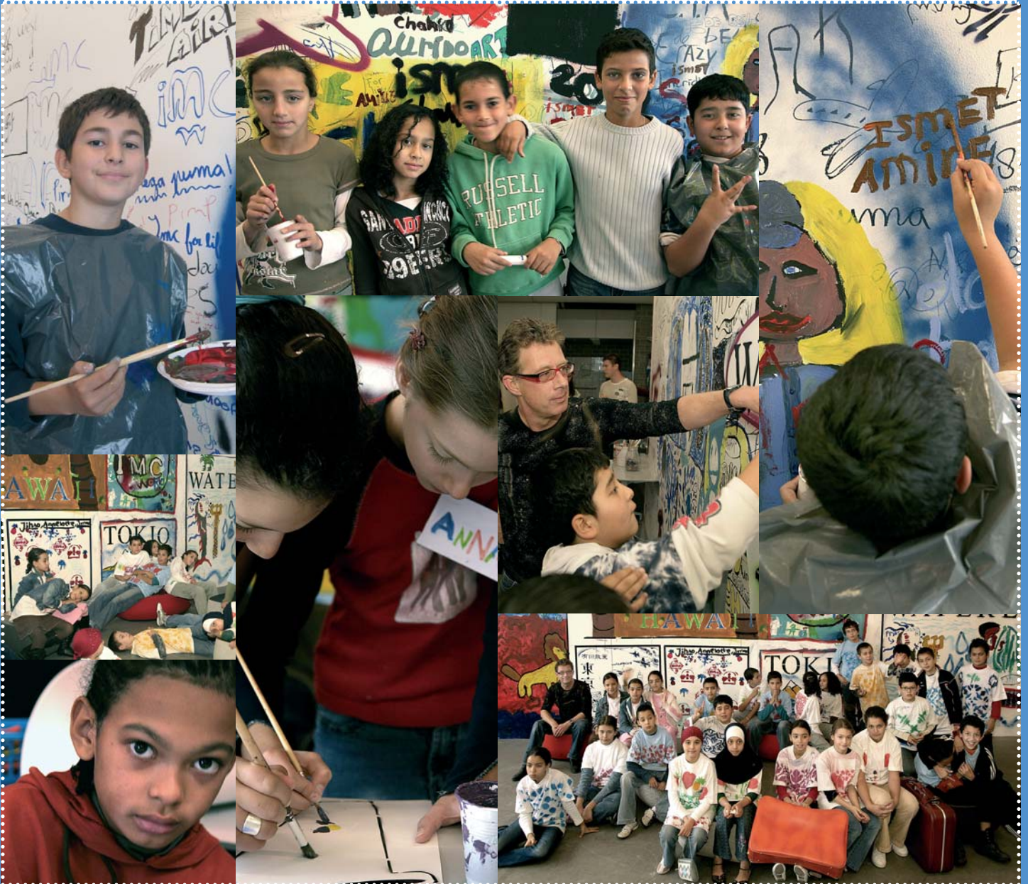
Tweedejaarsleerlingen van de weekendschool uit Amsterdam West toerden afgelopen oktober een zaal van Stedelijk museum CS om tot een wereldse airport lounge (zie ook pagina 4).

World Trade Center Amsterdam, AMC, Gemeente Amsterdam Noord, IBM, B&A Groep, PsyQ/Parnassia Groep, Cardano, Erasmus MC, Universiteit van Tilburg, Richard Engelfriet, Kamer van Koophandel Utrecht, Vader Rijn College.